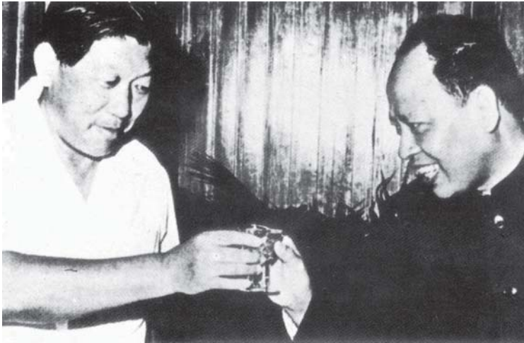
L'ambassadeur de Chine populaire au Cambodge, Sun Hao (à gauche) trinque avec Ieng Sary, beau-frère de Pol Pot et chef des affaires étrangères du « Kampuchéa démocratique ». Photo retrouvée par l'armée vietnamienne dans les archives abandonnées par les dirigeants khmers rouges en janvier 1979 à Phnom Penh lors de leur fuite.

pages d'archives servant de base aux travaux des chercheurs et au Tribunal spécial Khmers rouges installé à Phnom Penh avec l'appui des Nations unies pour juger les grands responsables encore en vie.