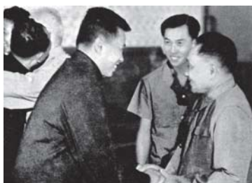
Durant sa visite en Chine, Pol Pot (à gauche) reçut le soutien appuyé de Deng Xiaoping pour les « succès » du « Kampuchéa démocratique » dans la constitution d'une « société sans classe » et contre le Vietnam.

nom de Mao ; la facilité d'emprunt des moyens de transports – non pas immobilisés par le chaos mais mis à la disposition des « rebelles » ; l'usage quasi sans limite des traitements cruels infligés aux détenus en l'absence de toute codification ; l'exemplarité conférée à l'humiliation publique violente des victimes désignées... Autant de facteurs qui n'ont pu que favoriser une généralisation des violences, qu'elles soient commises par l'État ou ce qu'il en restait, par ceux qui s'en réclamaient de leur seule autorité ou par des groupes spontanés dont les mobiles idéologiques étaient de plus en plus confus. De nombreux cas, qu'il est effectivement impossible de projeter à l'échelle nationale dans un schéma logique, mais n'en demeurent pas moins significatifs, témoignent de l'ampleur qu'a pu prendre la tendance au « débordement ».